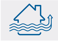
Freie bzw. natürliche Lüftung

In der Raumlufttechnik werden prinzipiell drei Arten von Lüftungssystemen zum Belüften/Klimatisieren unterschieden – alle drei verdünnen die Raumluft durch Zufuhr von Außenluft: